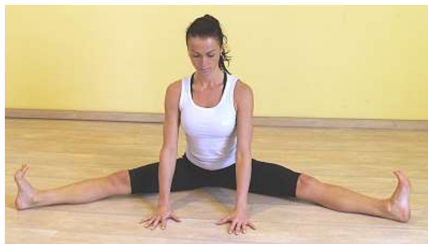
Sed roznožný so vzpriameným trupom