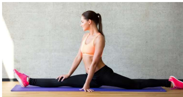
Šnúra z obidvoch strán