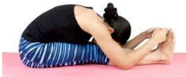
Hlboký predklon v sede